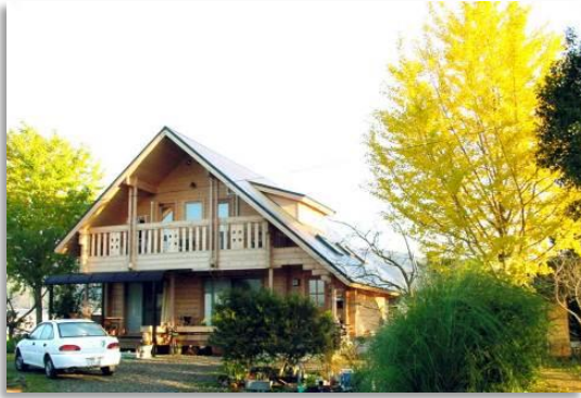
JCI Teleworkers' Network 事務局

本法人は、社会参加と就業に対する強い意欲を持ちながら、「心身の障害、難病、高齢」などのために、社会生活・職業生活の中で弱者の立場を強いられている人たち（チャレンジド）の、社会的・経済的自立の実現を目的として、平成11年4月に創設、平成14年1月に特定非営利活動法人として認証されました。