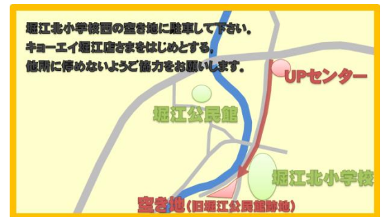
訓練場所駐車場案内図